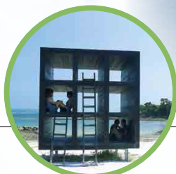
佐久島おひるねハウス