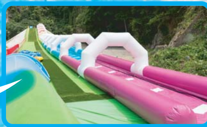
※高さ約9m、傾斜角度約7度、全長約80m(当社調べ)

吉良ワイキキビーチ スライダーパーク 営業時間 9:30 10:00 16:00 (15:30)