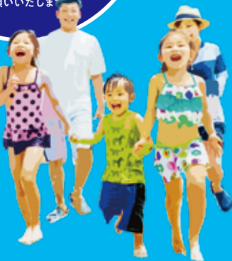
※イラストは「スライダーパーク」内のイメージです。 実際とは異なります。